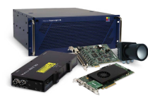
Capturadores de fotogramas, sensores y controladores