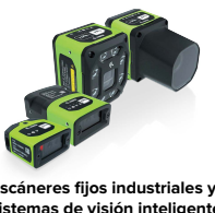
Escáneres fijos industriales y sistemas de visión inteligente