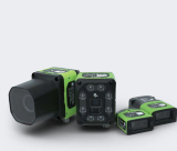
Cámaras de visión inteligente